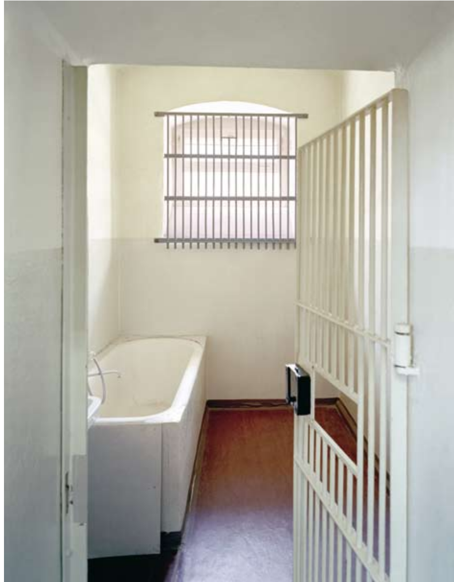
Sonderhaftanstalt Bautzen II, Badezelle, 2004