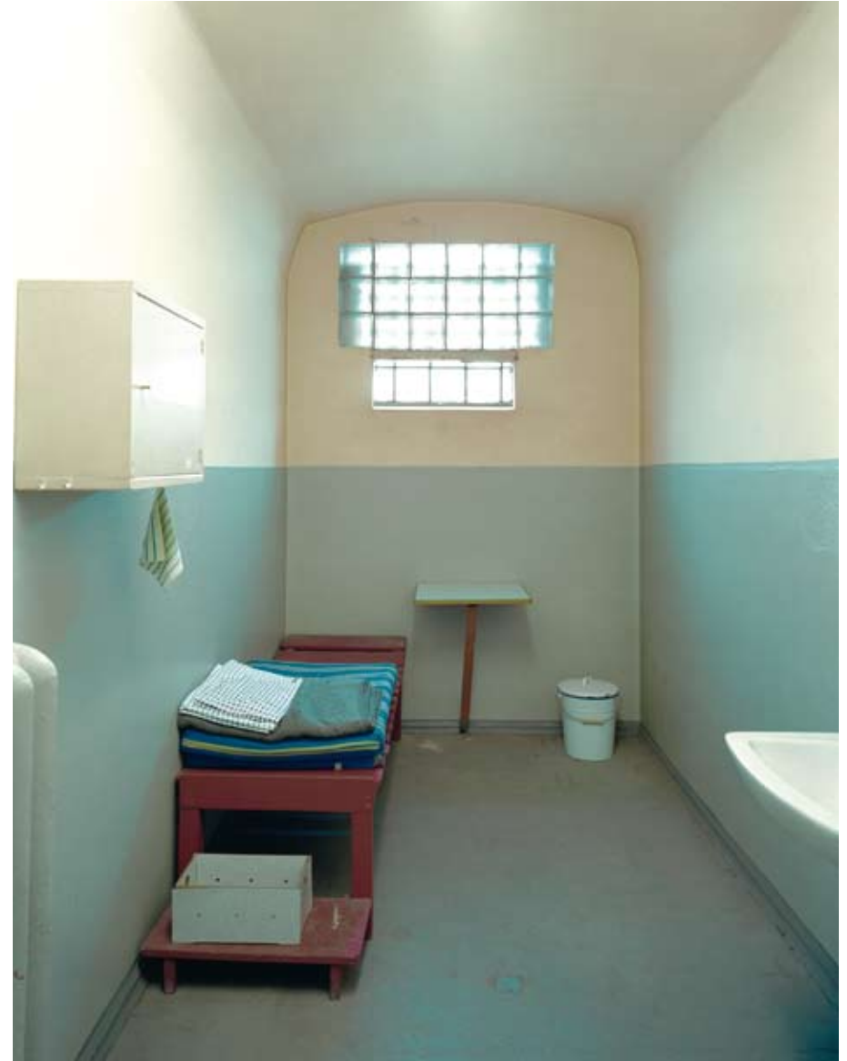
Untersuchungsgefängnis Potsdam, Zelle, 2004