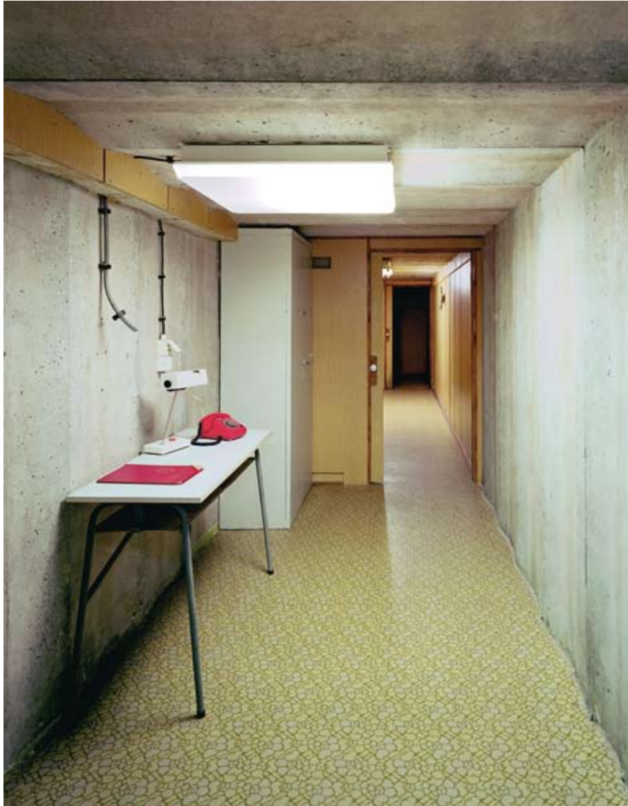
Bunker Frauenwald, Vorraum Bunkerkommandant, 2005