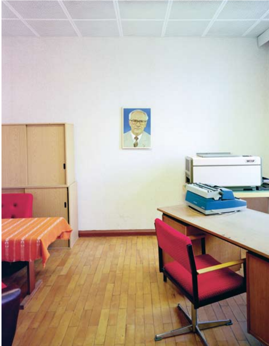
Sonderhaftanstalt Bautzen II, Direktionszimmer, 2004