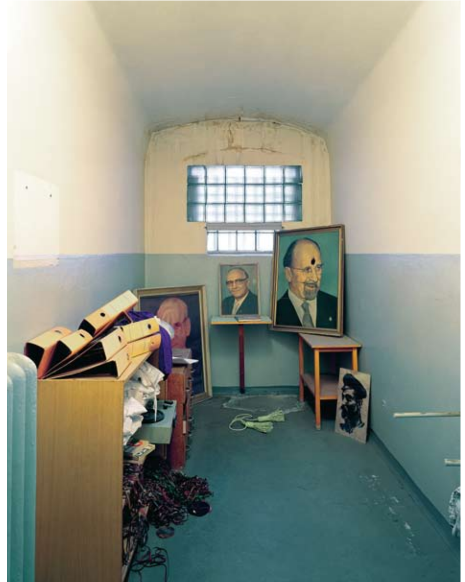
Untersuchungsgefängnis Potsdam, ehemalige Zelle, 2004