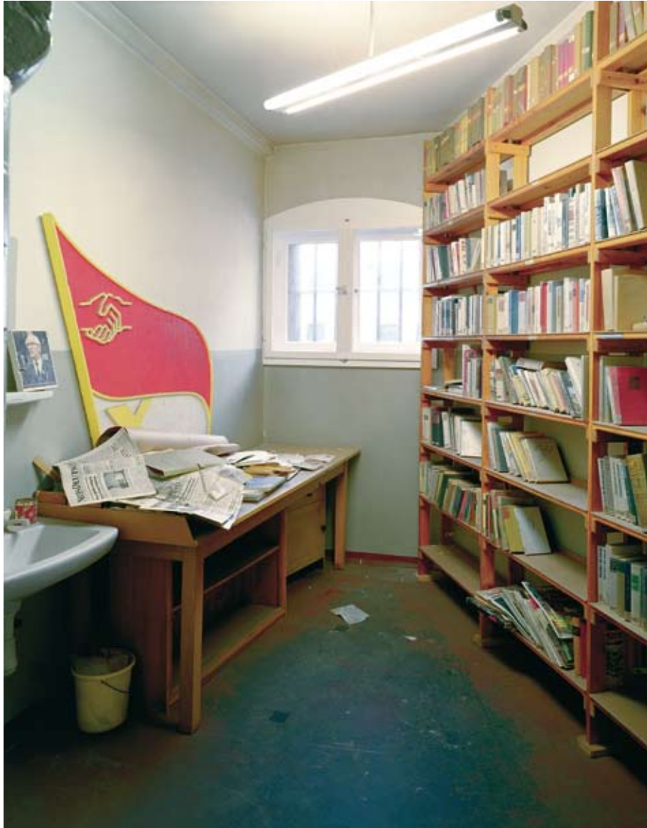
Untersuchungsgefängnis Potsdam, Häftlings-Bibliothek, 2004