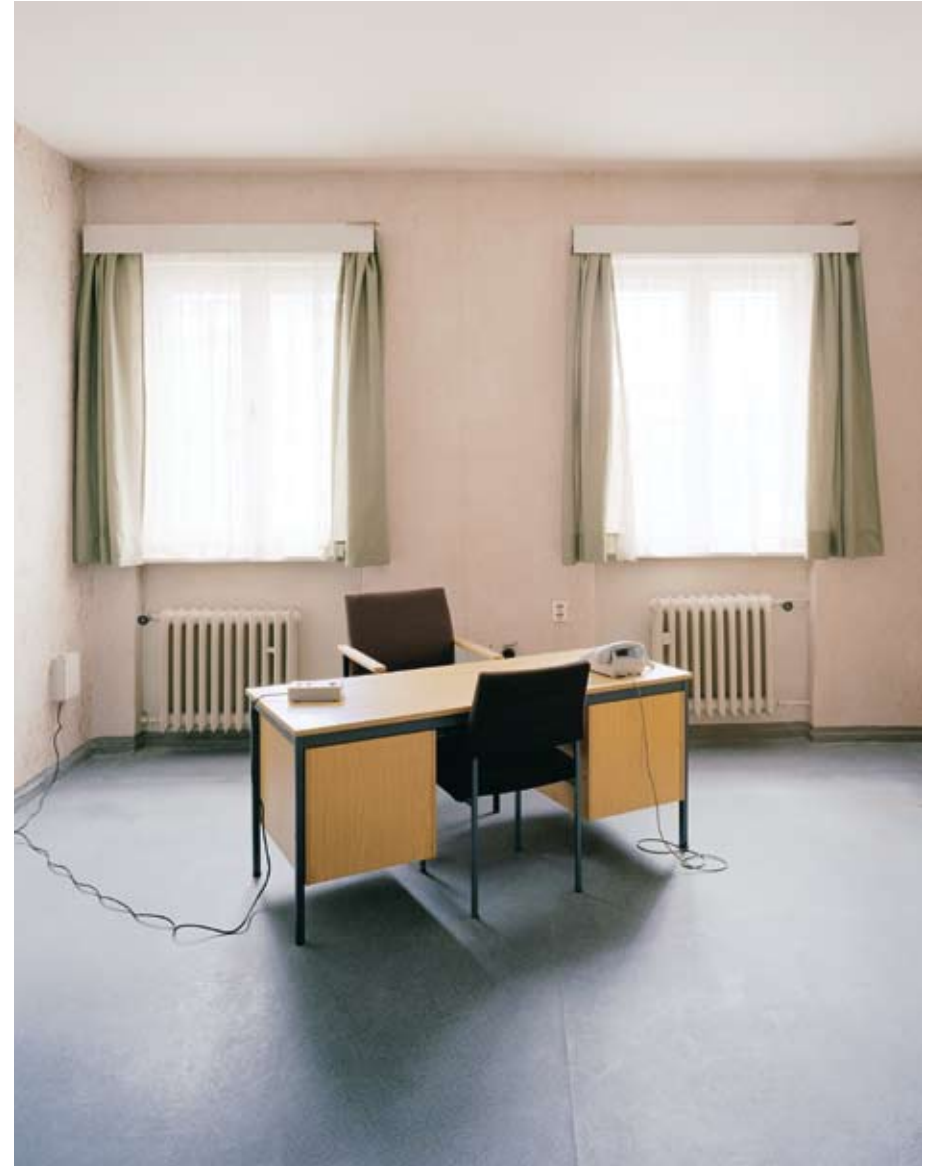
Untersuchungshaftanstalt Hohenschönhausen, Vernehmerzimmer, 2004