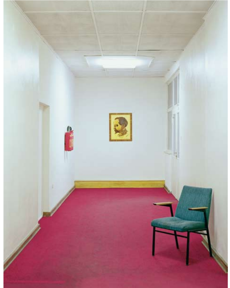
Mielke Etage, Flur, 2004