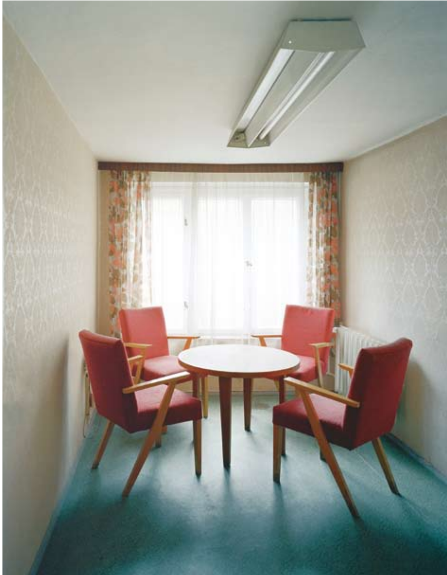
Sonderhaftanstalt Bautzen II, Besucherzimmer, 2004